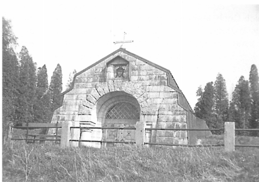
Průčelí mauzolea v Jindřichovicích. 1985

Tábor, jež postavili, zajatci udržovali v chodu; zároveň tu vyráběli munici. V okolí zastávali zemědělské práce na nosticovském velkostatku, pracovali v petzoldovsko-nosticovských nejdecko-rotavských železárnách v Dolní Rotavě, Oboře a Šindelově. Dřeli v blízkém rotavském čedičovém lomu, zpevňovali a stavěli silnice v okolí, např. nedokonče-