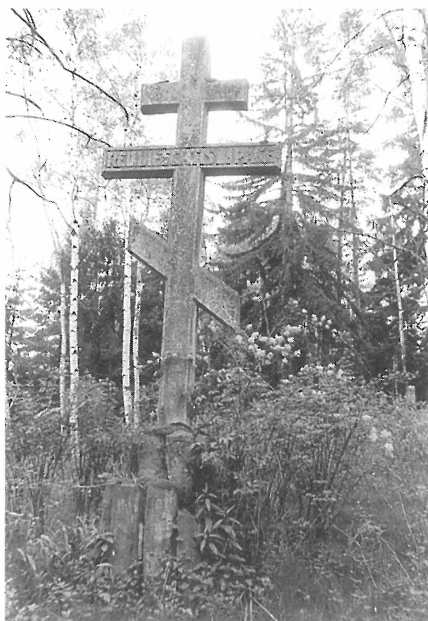
Patrišší kříž v pravoslavném díle lesního hřbitova. 1989

J. Wolfa. Do obou je vytesán latinský nápis REQUIESCATIS IN PACE (Nechť odpočívají v míru). Soukromou iniciativou pozůstalých, spadající do dob sblížení masarykovské ČSR s královstvím SHS, resp. Jugoslávie, tu byly pro lesní hřbitov vytvořeny i drobné kamenné pomníčky, symbolické náhrobky.