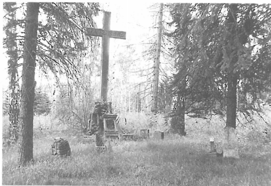
Latinský kříž v katolickém díle lesního hřbitova s pomníčky od pozůstalých. 1989

Nesčetné oběti vězňeni byly pochovány do hromadných hrobů v lese poblíž tábora. Zápis z 28.10. 1918 v kronice Okr. četnického velitelství v Kraslicích uvádí na lesním hřbitůvku 3800 pohřbených. Ve 20. letech 20. stol. dalo městečko Jindřichovice pohřebišti pietně upravit: obehnat plotem s brankou a v jeho katolické i pravoslavné části vztyčit dva vysoké kamenné kříže, latinský a patriarší, v patách obložené sloupci rotavského čediče. Zhotovila je místní firma kameníka