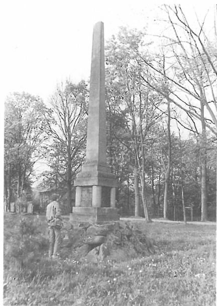
Obelisk obětem 1. sv. války v Jindřichovicích. Foto autor, 1989.

nou cestu od Nosticova zámečku Favorit do Nejdku, tehdy okresního města. Pracovní komanda odtud (údajně denně časně ráno) docházela v l. 1915-18 stavět chemičku ve Falknově (Sokolově) včetně vlečky k ní, již budoval labskoústecký Spolek pro chemickou a hutní výrobu a jež zahájila provoz v říjnu 1917. Jak ve 30. letech 20. stol. napsal časopis zdejší české menšiny Výspa, vysílení zajatci prý přitom byli shazováni do Ohře a nalézáni daleko po proudu. Cenné dobové snímky, zachycující jak celkové panorama tábora s Krušnohořím včetně Rotavy v pozadí, tak pohledy do něj (kuchyně, ubikace, lazaret, kaple atd.) jsou dnes v jindřichovickém zámku, sídle sokolovského okr. archivu.